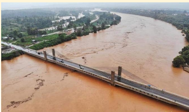
Pont à Sékong qui permet de relier les hôpitaux de district et les centres de santé éloignés.

De nombreux villageois ont aussi perdu une partie de leur cheptel alors que la fièvre porcine africaine venait déjà de décimer une bonne partie des porcs de la province.