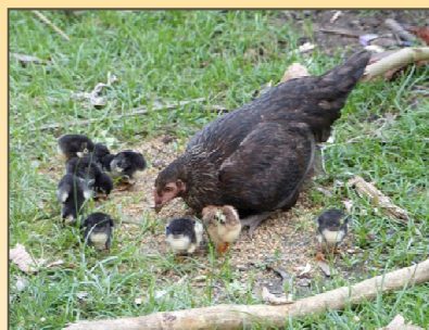
Les premiers poussins. 10 seront donnés à une nouvelle famille

Un comité de village supervise cette action ainsi que des auxiliaires vétérinaires formés par notre équipe.