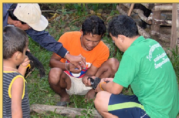
L'auxiliaire vétérinaire du village apprend à vacciner les poules

L'équipe procède de manière similaire pour les porcs et les volailles. Les poussins de la première couvée sont remis à de nouvelles familles.